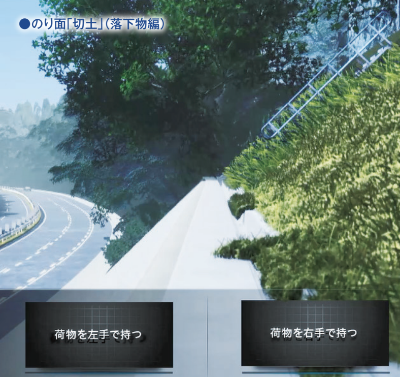
●のり面「切土」(落下物編)