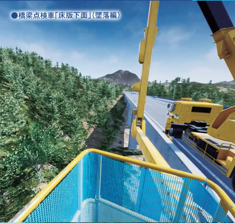
●橋梁点検車「床版下面」(墜落編)