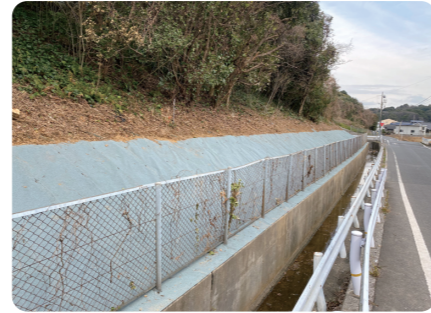
盛土のり尻部(九州道 北九州)