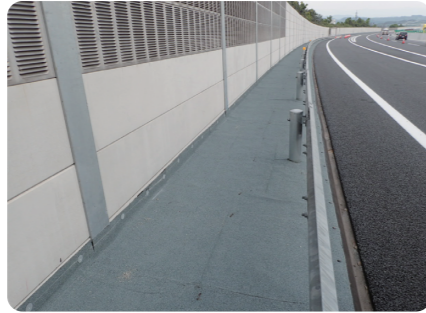
本線路肩(九州道 熊本)