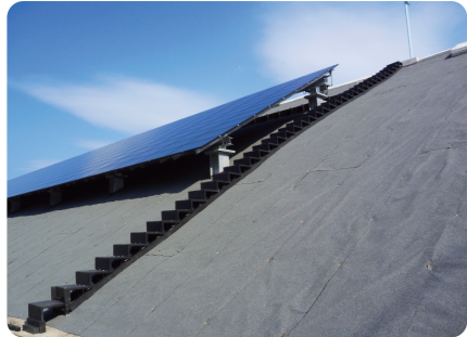
太陽光パネル下(東九州道 日向)