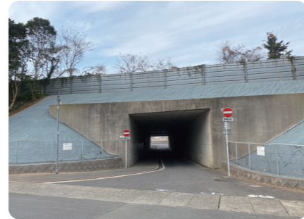
C-BOX上部(九州道 北九州)